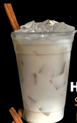
Horchata Sabado y Domingo