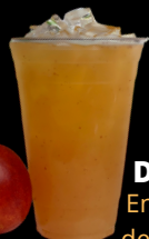
Durazno En temporada de verano