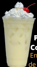
Piña Colada En temporada de verano

Aguas de frutas frescas hechas con FRUTA NATURAL. Elegimos un sabor diferente todos los días por favor checa nuestras publicaciones en las redes sociales para ver el agua del día.